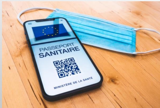
PASS SANITAIRE OBLIGATOIRE